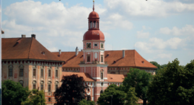
Lobkowiczký zámek a románský hrad

S názvem oblasti Roudnicko se můžeme setkat i v podobě Podřipsko, jelikož se jedná o oblast pod horou Říp . V samotné Roudnici nad Labem i okolních obcích nalezneme velké množství atraktivit, ať už v podobě historických památek, vinařských lokalit či přírodních zajímavostí. Oblast je turisticky dostupná po železnici, silnici i vodě.