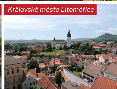
Královské město Litoměřice