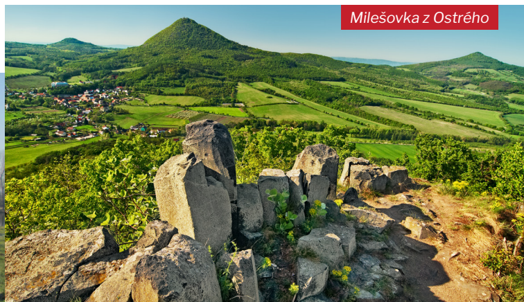
Milešovka z Ostrého

Destinace České středohoří je lokalitou s neopakovatelnou atmosférou krásné přírody, vysokých čedičových kup a rovněž oblastí hradních zřícenin, které tyto dominantní vrcholy korunují. Mnohotvárnou geologickou stavbu vulkanického pohoří a zachované lesní porosty doplňuje pestrá paleta pastvin, luk a polí, což vytváří v rámci ČR jedinečnou rozmanitost.