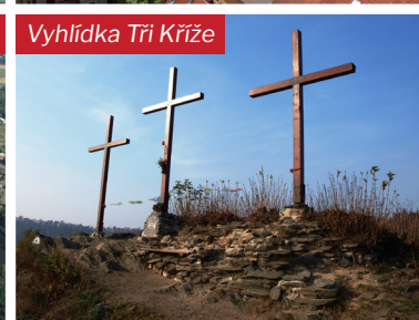
Vyhlička Tři Kříže