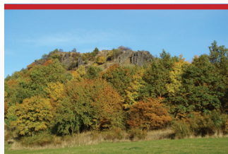
↑ Holý vrch (577 m n. m.)

Holý vrch → Tato přírodní rezervace zaujímá část erodovaného zbytku příkrovu olivinitického nefelinitu (alkalická hornina podobná čedičům). Je to relativně plochý vrch v CHKO České středohoří s nejvyšším bodem 577 m n. m. (známý pod názvem Lysá hora). Z velmi strmého svahu vyčnívá několik skalek (mrazových srubů), rozdělených do svislých sloupců, někde i přes 10 m vysokých. Některé připomínají hradby s cimbuřím, jiné zase menhiry - např. tzv. Učitel a žáci.