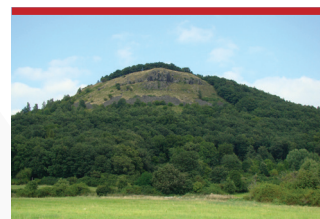
↑ Hradiště (545 m n. m.)

Hradiště → Hradiště je přírodní památka, která se nachází na stejnojmenném vrchu (545 m n. m.) 4 km severozápadně od Litoměřic. Výrazná dominanta okolí Litoměřic, zčásti zalesněná hora se stepními loukami, skalnatými výběžky a sutěmi. Vrchol hory nabízí nádherný rozhled do širokého okolí.