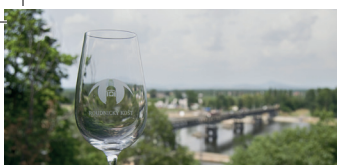
13. 6. Roudnický košť