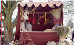
11.-19. 9. Zahrada Čech