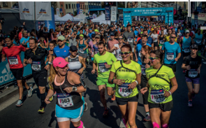
19. 9. Mattoni 1/2Maraton