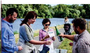
27. 6. Putování za víny Brány Čech