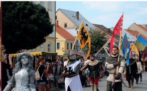
15. 8. Úštěcký historický jarmark