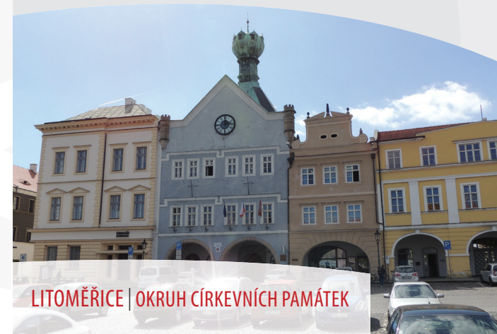
LITOMĚŘICE | OKRUH CÍRKEVNÍCH PAMÁTEK

Jízdní řády lodní dopravy a motoráčku T4: www.ceskestredohori.info/doprava