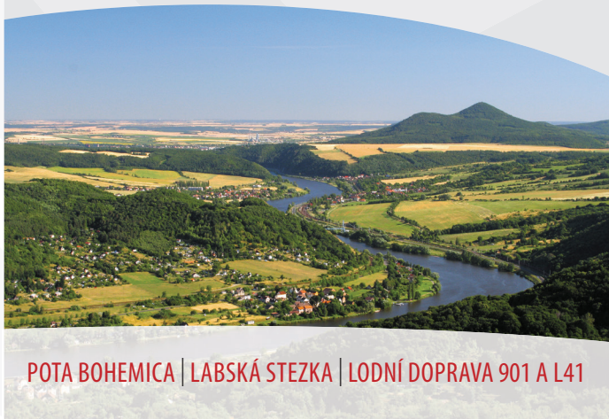
POTA BOHEMICA | LABSKÁ STEZKA | LODNÍ DOPRAVA 901 A L41

Druhý den brázdíme trasu Švestkové dráhy . Nejprve se musíme dopravit do Lovosic, a to osobním