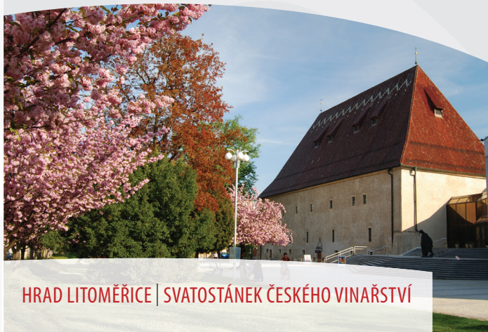
HRAD LITOMĚŘICE | SVATOSTÁNEK ČESKÉHO VINAŘSTVÍ

V Litoměřicích si nesmíme nechat ujít novinku. V letošní sezóně se představí vybrané církevní památky města Litoměřice. V rámci nového turistického produktu „ Okruh církevních památek “ se můžeme seznámit s vybranými památkami a ještě